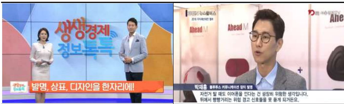
주요 매체 홍보 및 수상자 인터뷰(예시)